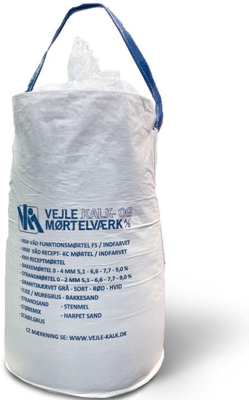
Billede af færdigemballeret mørtel

Nedenfor ses billeder af det deklarerede produkt, både emballeret og løst.