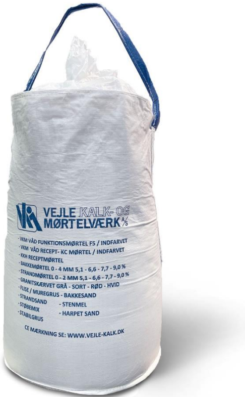
Billede af færdigemballeret mørtel

Nedenfor ses billeder af det deklarerede produkt, både emballeret og løst.