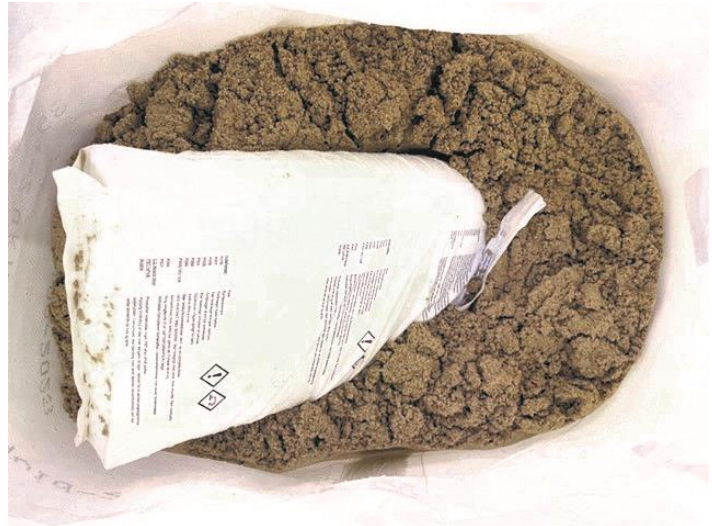
Fotoet af den åbne kegle viser, hvordan det fabriksafmålte/blandede produkt leveres som færdigmix til byggepladsen

Produktet i denne EPD deklarerer som ufarvet mørtel (farve Grå-1). Mørteltypen kan leveres i en række andre farver, som ikke er omfattet af denne EPD. Yderligere information kan findes på producentens egen hjemmeside: https://vejle-kalk.dk/