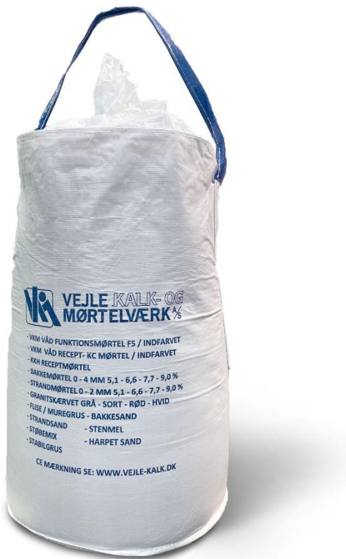
Billede af færdigemballeret mørtel

Nedenfor ses billeder af det deklarerede produkt, både emballeret og løst.